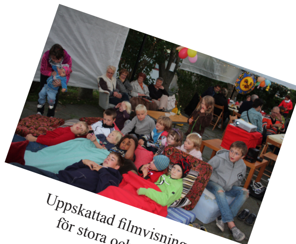
Uppskattad filmvisning för stora och små.

Lördag 4 september hjälptes vi åt att städa och röja i våra gemensamma utrymmen. Container fanns på plats och en miljöstation för diverse miljöfarligt avfall fanns i möbelförrådet.