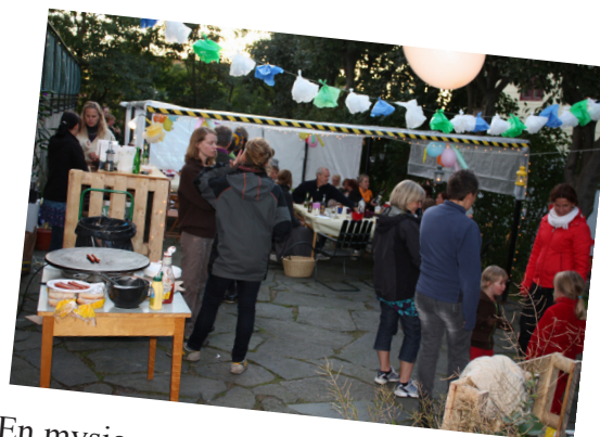
En mysig, uppskattad ny festplats invigdes, under torklinorna mellan gårdarna.

En mycket trevlig kväll i goda grannars sällskap.